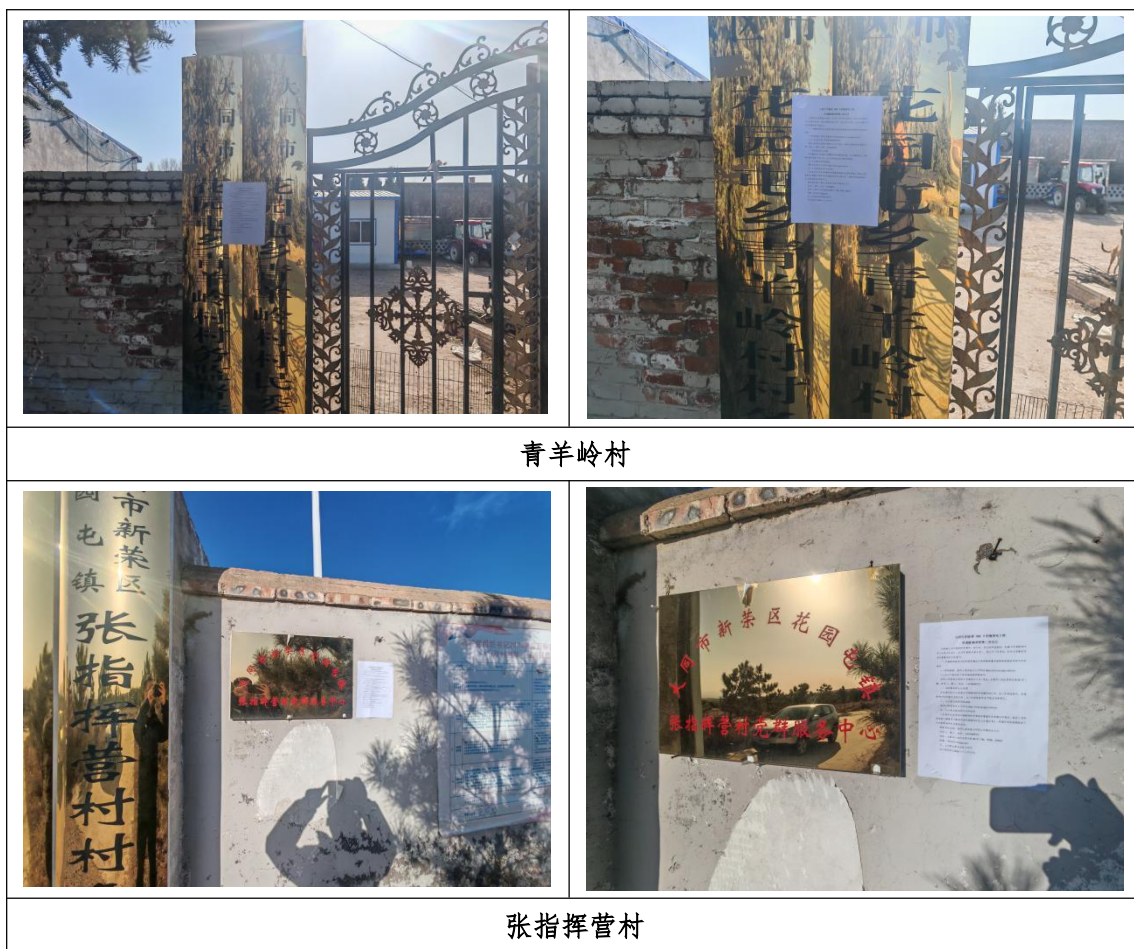
图 5 现场张贴照片