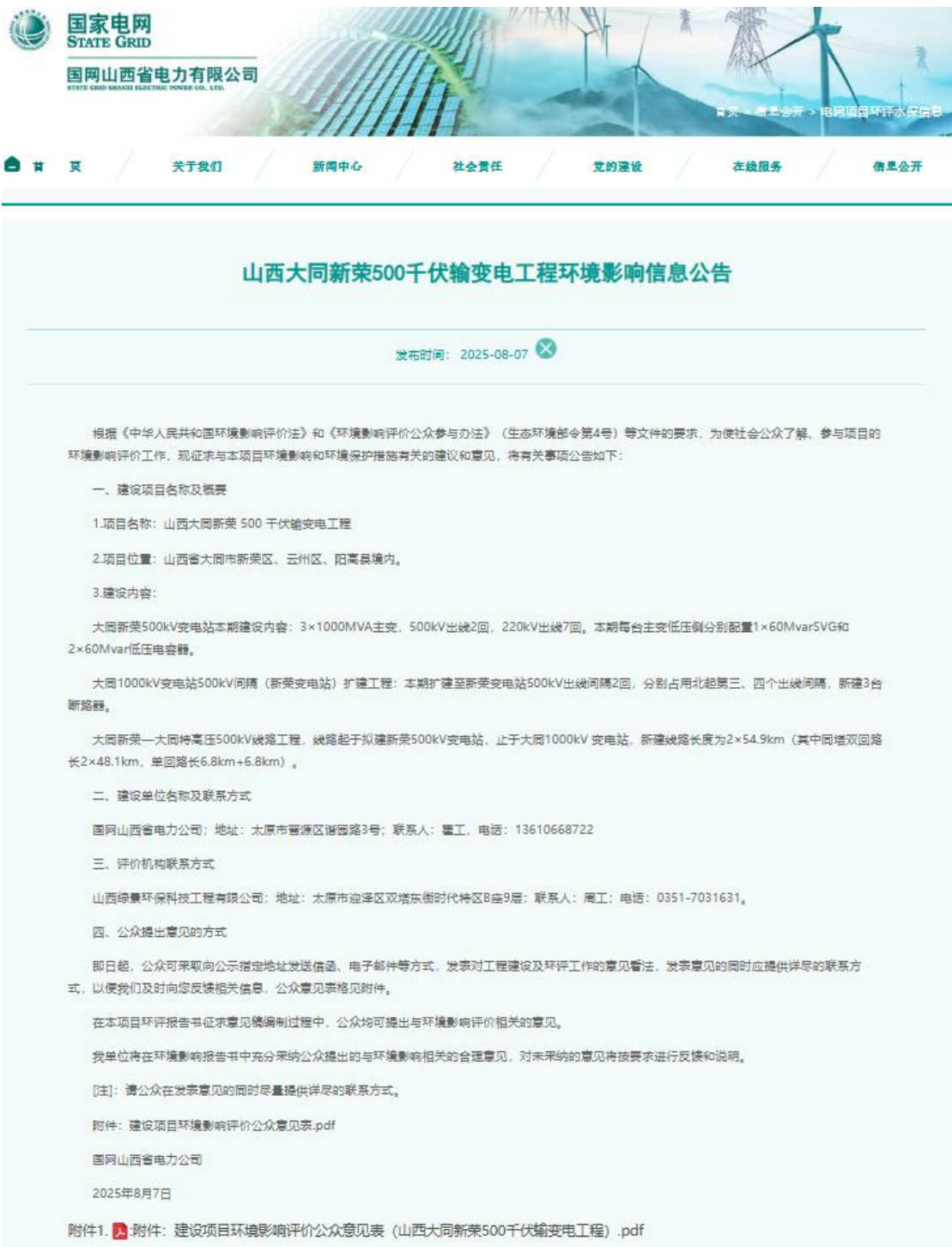
图 1 首次环境影响评价信息公开网络公示截图